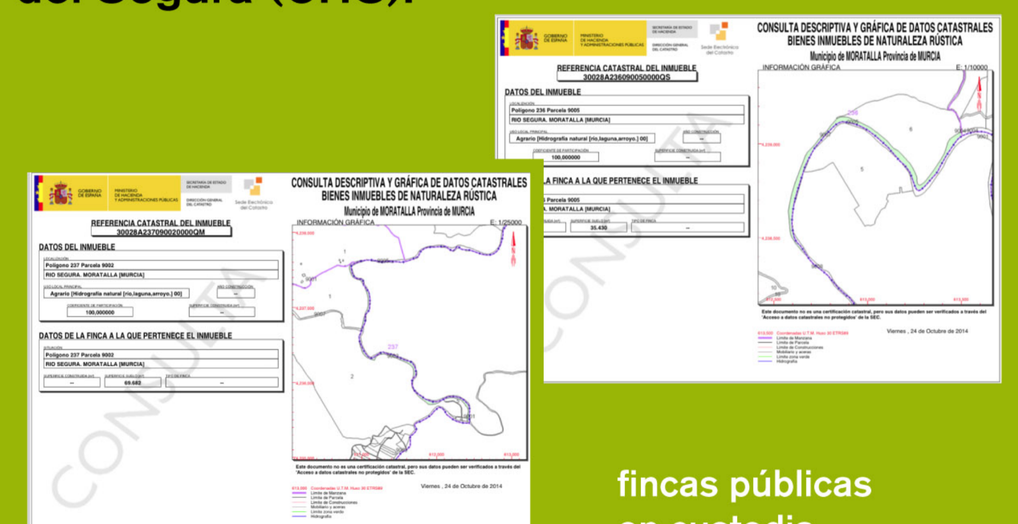
fincas públicas en custodia

12,6784 ha en la reserva natural de 'Sotos y Bosques de Ribera de Cañaverosa', Moratalla y Calasparra (Región de Murcia). Propiedad de la Confederación Hidrográfica del Segura (CHS).