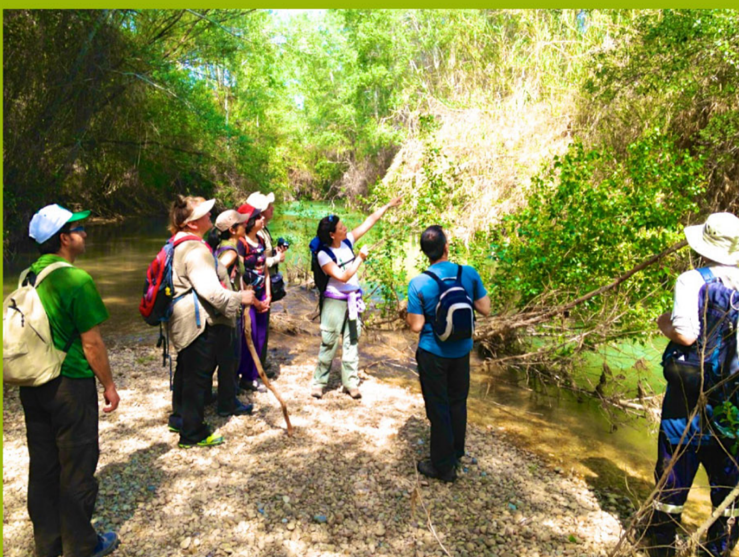
ruta interpretativa en Senda de la Huertecica

Mediante acciones de voluntariado (restauración en ríos, acondicionamiento de sendas, limpieza de litorales,...) se han alcanzado los objetivos de protección propuestos en los proyectos, así como ha favorecido el éxito en termino de mantenimiento y conservación de las intervenciones a lo largo del tiempo.