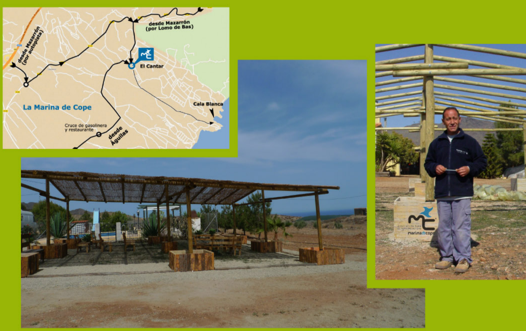
finca sita en Marina de Cope

Instalaciones y terreno de la asoc. turismo activo del Cantar, en la Marina de Cope en Lorca (Región de Murcia).