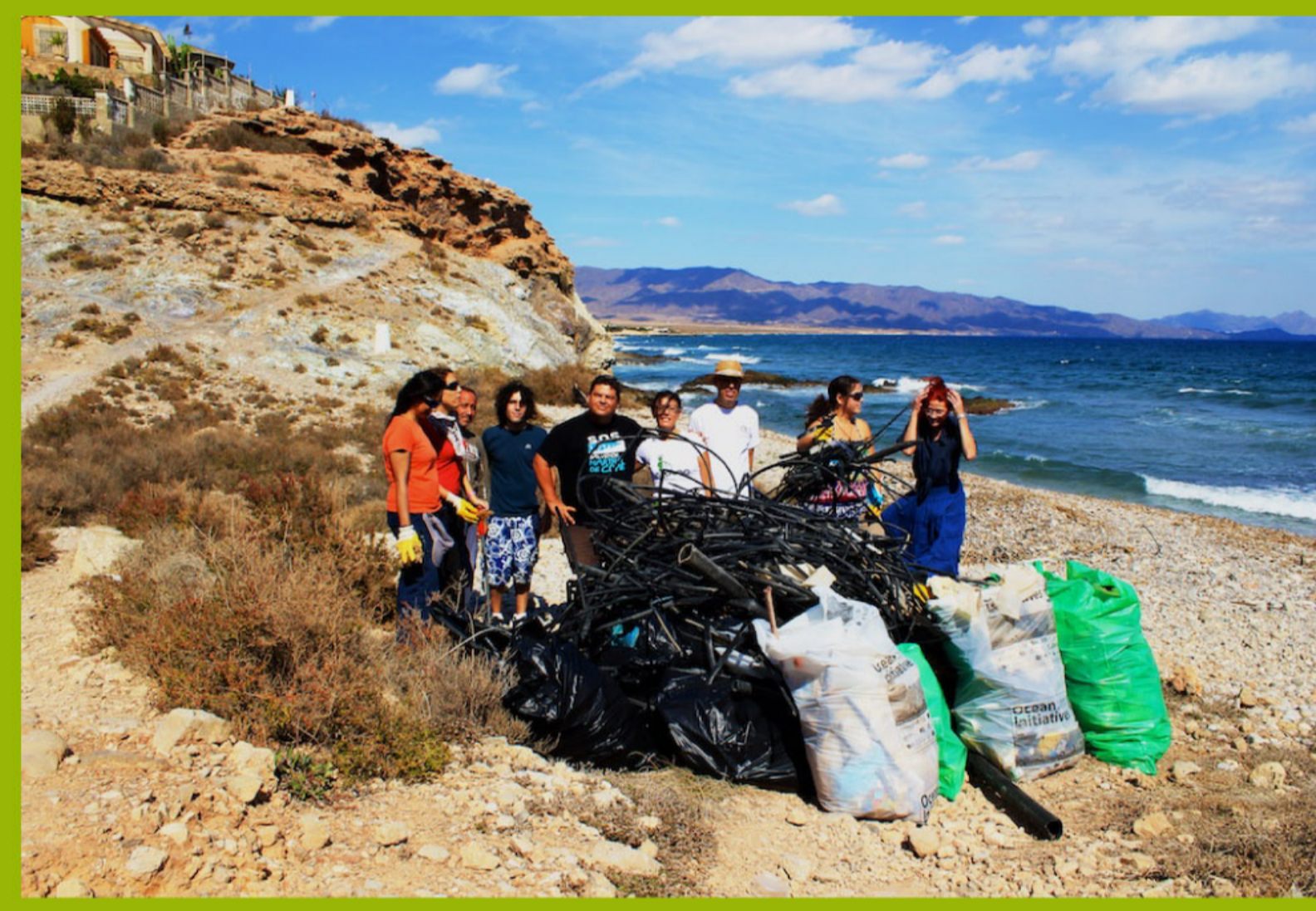
acción de voluntariado en litoral