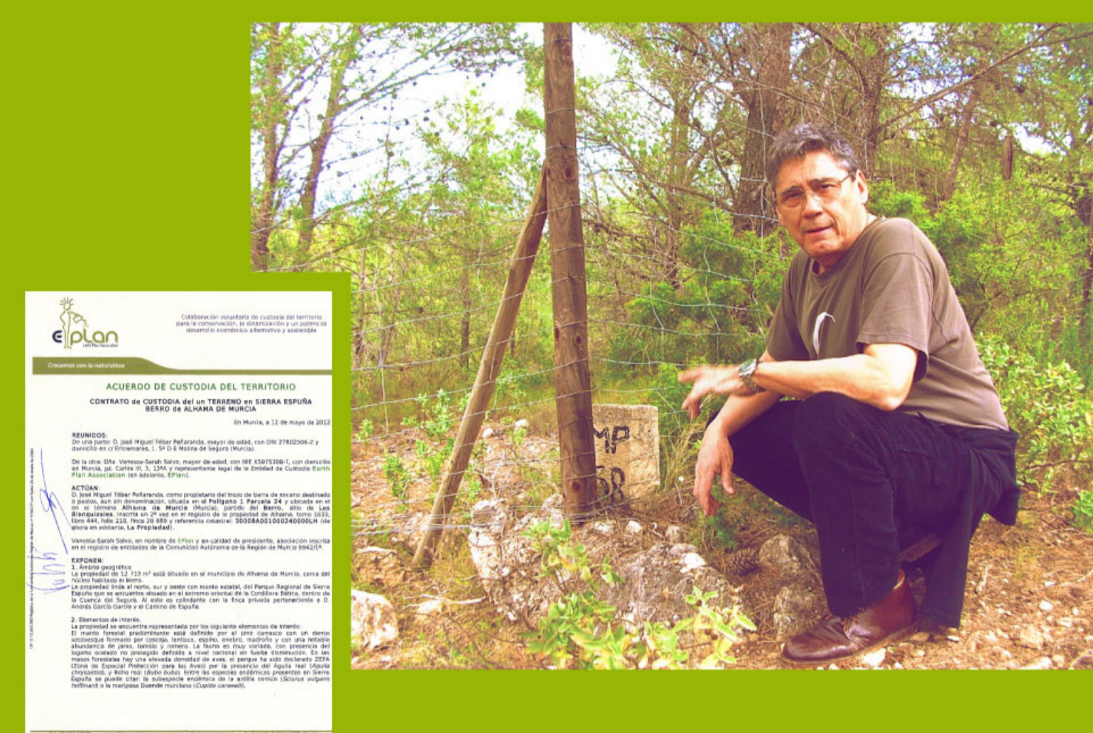
propietario de la finca sita en El Berro

Los Blanquizales del Berro, cerca del Parque Regional de Sierra Espuña en Alhama de Murcia (Región de Murcia).